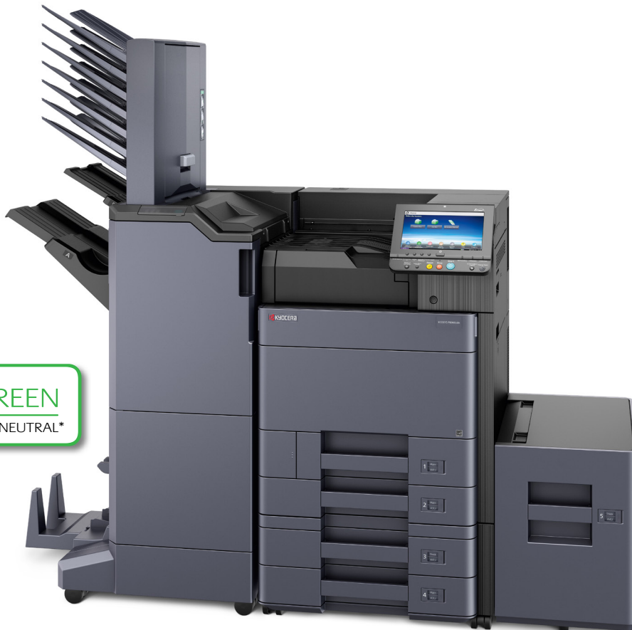
Abbildung mit Optionen.