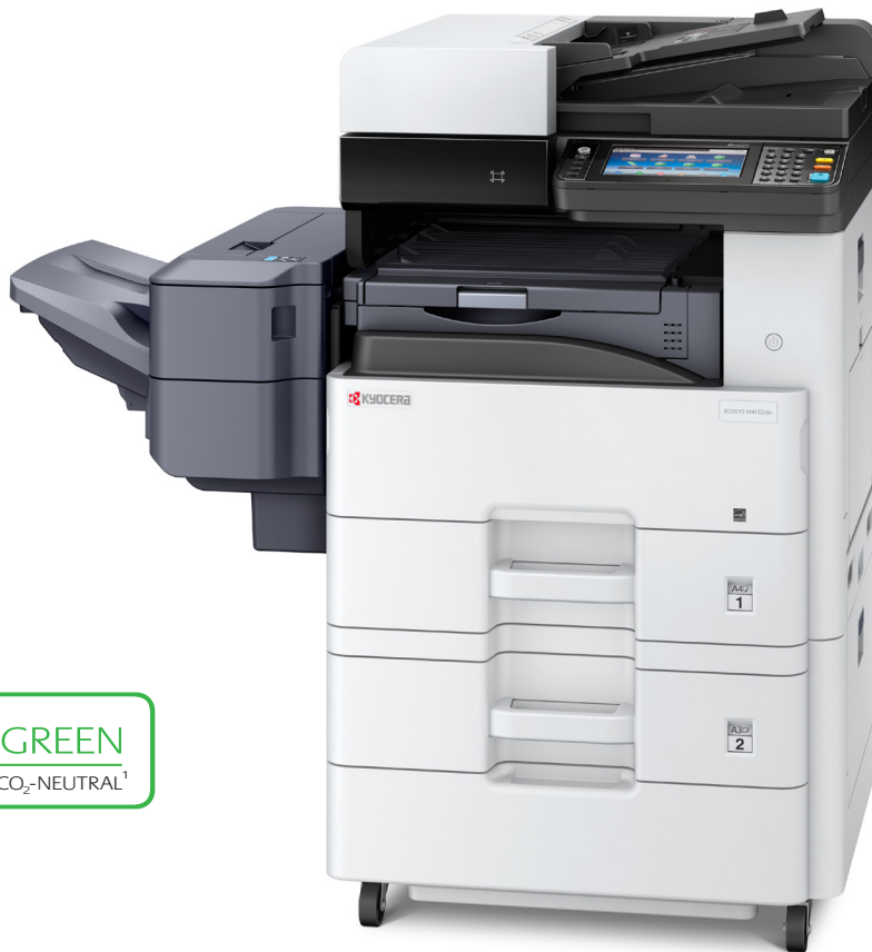
Abb. zeigt ECOSYS M4132idn mit Optionen